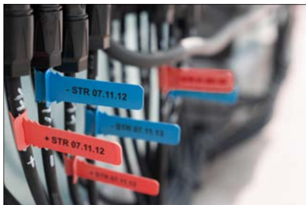
TAGPU LOOP - rozwiązanie ułatwiające identyfikację falownika.

TAGPU LOOP to szyldy oznaczeniowe przeznaczone do identyfikacji wiązek przewodów i kabli o średnicach od 2,8 mm do 35 mm, bez użycia opasek kablowych. Szyldy te są szczególnie polecane do stosowania wszędzie tam, gdzie wymagane jest użycie trwałych i odpornych na działanie promieniowania UV oznaczeń. Wykonane są z wytrzymałego i elastycznego poliuretanu i doskonale sprawdzają się jako oznaczniki przewodów pracujących w trudnych warunkach środowiskowych. Materiał został dostosowany zarówno do druku na drukarkach termotransferowych jak i do znakowania laserowego. Nadruki zalecamy wykonywać za pomocą wysokiej jakości drukarek termotransferowych i taśm barwiących HellermannTyton lub laserowych urządzeń znakujących.